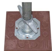
Ergots de maintien du socle réglable