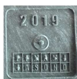
Dateur et N° de lot